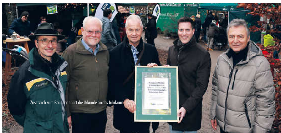
Zusätzlich zum Baumerinnert die Urkunde an das Jubiläum.

Mit der Elsbeere hat man für die Pflanzung einen klimaresistenten, heimischen Laubbaum gewählt, der sich sehr gut für trockene bis sehr trockene Standorte in warmen Regionen eignet. Elsbeeren können zwischen 20 und 30 Meter hoch werden und sind aufgrund ihrer Eigenschaften ideal für den Waldbau im Klimawandel. Weil Nadelwälder aufgrund der globalen Erwärmung stark geschädigt sind und keine gute Zukunft haben, sollen sie durch laubholzreiche Mischwälder ersetzt werden. Neben Traubeneichen, Hainbuchen und Linden werden deshalb auch Elsbeeren gepflanzt, die bestens an das künftige Klima angepasst sind. (dyh)