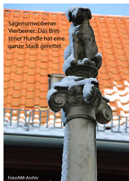
Sagenumwobener Vierbeiner: Das Brettener Hundle hat eine ganze Stadt gerettet.

Und da wäre noch die Geschichte vom Hexenbiss am Heidelberger Schloss, das älteste Musikinstrument der Welt oder auch die Antwort auf die wichtige Frage, warum Badener auch als „Gelbfüßler“ bezeichnet werden. Diese und noch viele andere spannende Anekdoten und Legenden zeigt unsere Rubrik „Unnützes Heimat-Wissen“ auf. (haf)