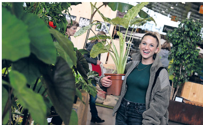
Alles für den grünen Daumen