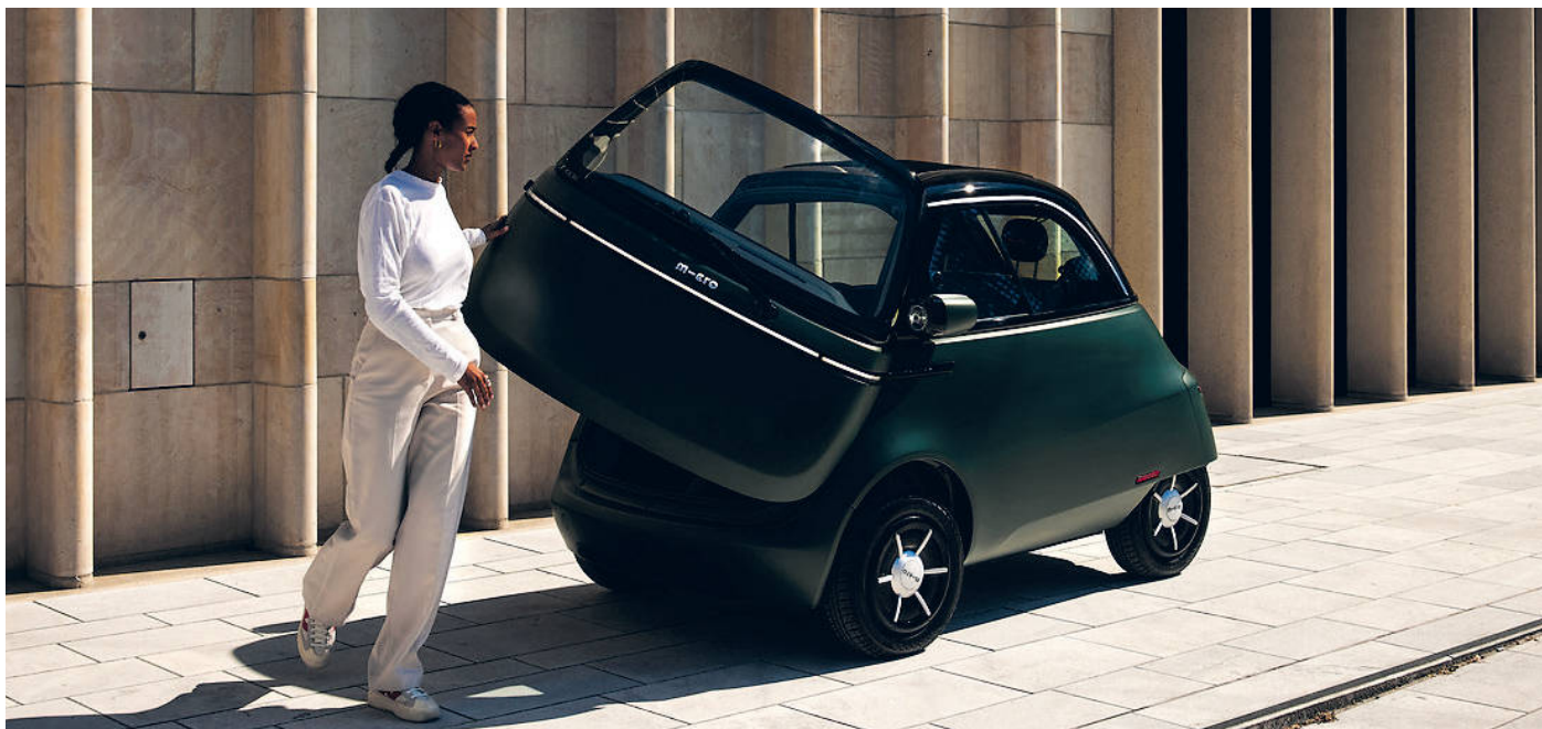
Der neue Microlino: Urbane E-Flitzer und viele weitere Fahrzeuge vor Ort testen – auf der i-Mobility!