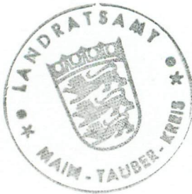
Landratsamt Main-Tauber-Kreis - Kreisbauamt -